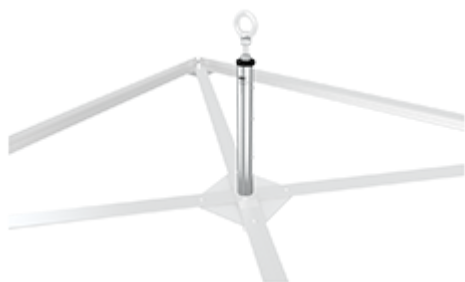
ABS Weight OnTop Double Stützrohr Edelstahl-Verstärkung für ABS Weight OnTop Double