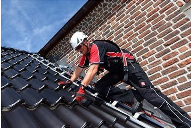
„Neue Sicherheitsdachhaken jetzt mit Blitzschutzanbindung.“