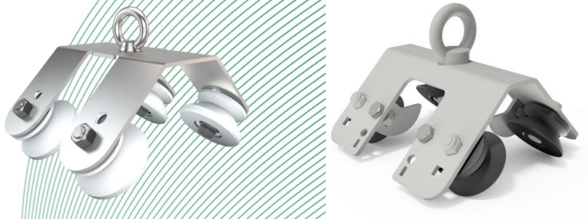
Bilder 1 - 2: Anschlageinrichtung, Typ: ABS RunBeam in der Standardausführung als Set zur Montage der Rollen vor Ort (links) und mit vormontiertem Rollensatz (rechts)

An der frei drehbaren Anschlagöse kann sich der Benutzer mit seiner mitgeführten persönlichen Schutzausrüstung gegen Absturz sichern. Die Anschlageinrichtung besteht aus korrosionsbeständigem Material und ist für eine Überkopf Anwendung vorgesehen.