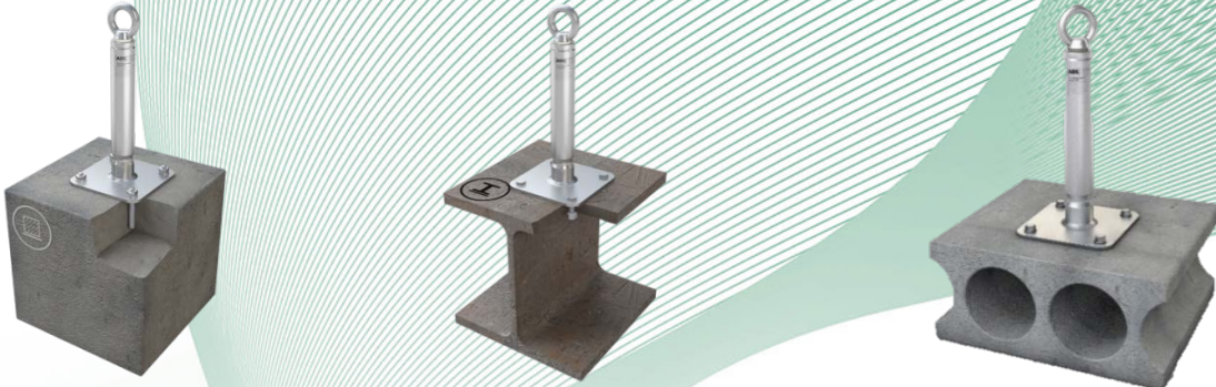
Bilder 4 - 6: Anschlageinrichtung, Typ: ABS-Lock® X-SR mit Sicke (Montagebeispiele)