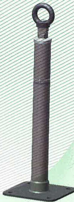
Bild 2: Anschlageinrichtung, Typ: ABS-Lock® X-SR mit Verlängerung